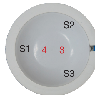
SCN-P360E3.03 Rückansicht - Back view